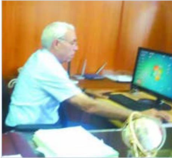
جامعة بومرداس هي الأحدث من حيث التنظيم والسرعة في تسليم الشهادات في موعدها مقارنة بالجامعات الكبرى المتواجدة على مستوى الوطن، وهذا بشهادة الطلبة أنفسهم.

الطلبة، خصوصا العلمية مثل علوم المهندسين والعلوم التكنولوجية، وكذا العلوم الاقتصادية التي لها صلة كبيرة بسوق الشغل، لاسيما وأنه في الوقت الراهن تسعى الجزائر إلى دعم الاقتصاد الوطني، ومن هنا يأتي دور الجامعة في تحديد ماهية التخصصات، وماهو الدور الفعلي الذي تقوم به، فهي تسعى لتكوين الطلبة بهدف إدماجهم في الحياة العملية، والقضاء على مشكل البطالة، وليس التكوين بهدف التكوين فقط، والتفكير في مستقبل الشباب المتخرج، فقط من الأهمية التوجه نحو التكوين وفق متطلبات السوق، إلا أن تخصصات الكيمياء وهيدرولوجيون والمحروقات، لم تسجل عليها إلا بالا أضعفا كبيرا، وهذا راجع إلى معدلات القبول المرتفعة.